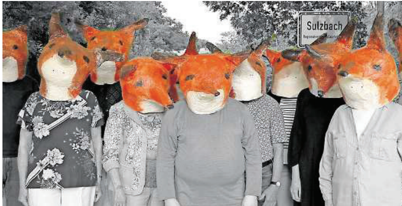
Am Freitag, 13. September, um 20 Uhr findet die Premiere des Schauspiels „Weh dem, der aus der Reihe tanzt“ nach Ludwig Harig in der sparte4 aufgeführt.

Saarland Saga zweiter Teil – Schauspiel nach dem Roman von Ludwig Harig